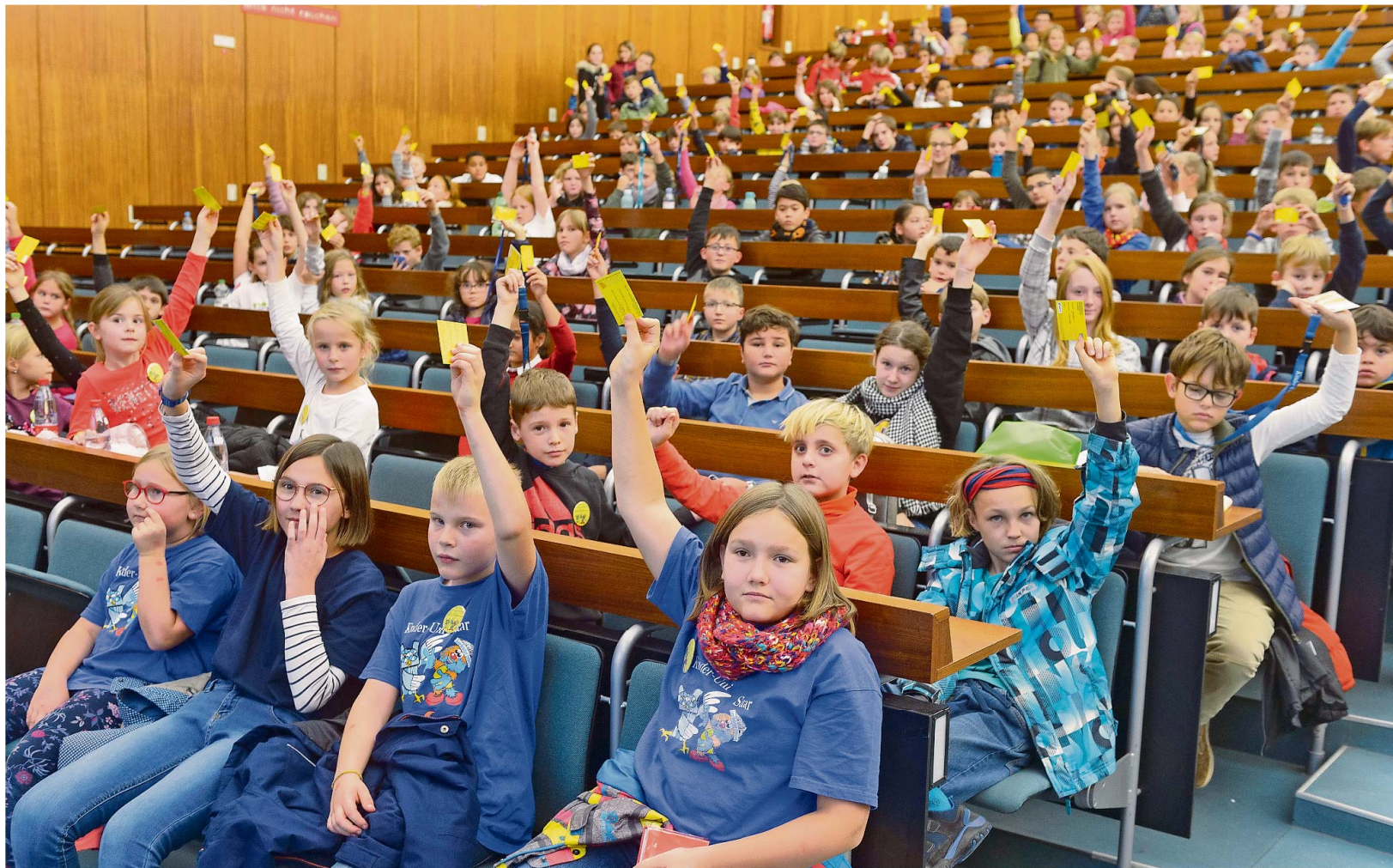
Auch im kommenden Sommersemester erwarten die jungen Studenten wieder spannende Themen bei der Kinderuni.